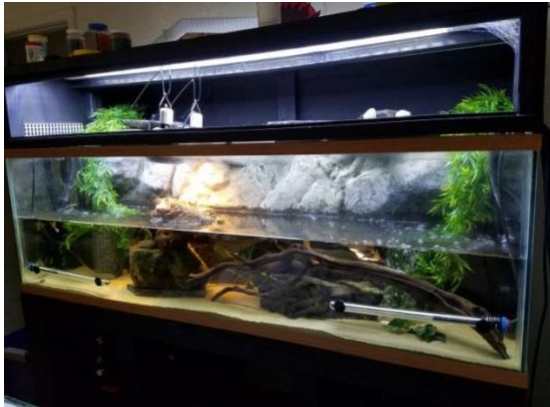
Een aquarium met een gevarieerde inrichting.