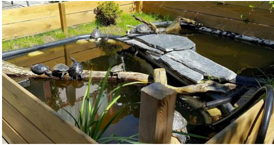
Een buitenvijver met mogelijkheden om op te drogen en te zonnen. ( https://chrysemys.nl/caresheets/trachemys-caresheet )