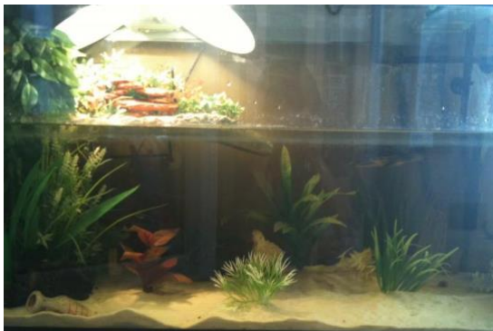
Een hoger liggend droog deel met zonnemogelijkheid. Een mogelijkheid om eieren af te leggen ontbreekt (uitsluitend mannelijke dieren).