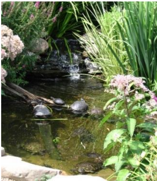
Een buitenvijver blijft altijd het mooist en gaat bijna altijd goed – met voldoende aandacht voor de winterslaap en voor de temperatuur in kwakkelzomers. ( https://www.huisdieren.nu/reptielen-en-amfibieen/soorten/schildpadden/roodwangschildpad-geelwang-schildpad-geelbuik-schildpad-trachemys-scripta )

( https://www.latortuefacile.fr/upload/images/1305306783.jpg )